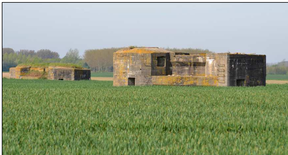
Abris en béton armé construits par les Allemands à Illies

L'exposition a pour objectif de dévoiler l'histoire méconnue des abris en béton construits pendant la Grande Guerre en Flandre française. Après une description et une analyse des conditions de la guerre de position dans la région, l'exposition présente l'histoire de ces ouvrages militaires édifiés par les troupes allemandes, dans le pays de Weppes et le Bas-Pays, puis par les soldats alliés dans la plaine de la Lys. Aujourd'hui encore, ces « blockhaus » sont présents par centaines dans le paysage de la Flandre française. L'histoire des hommes qui ont conçu et réalisé ces fortifications est également racontée à l'aide de documents inédits, provenant de différentes institutions ainsi que du Centre d'Histoire de l'A.T.B.14-18.