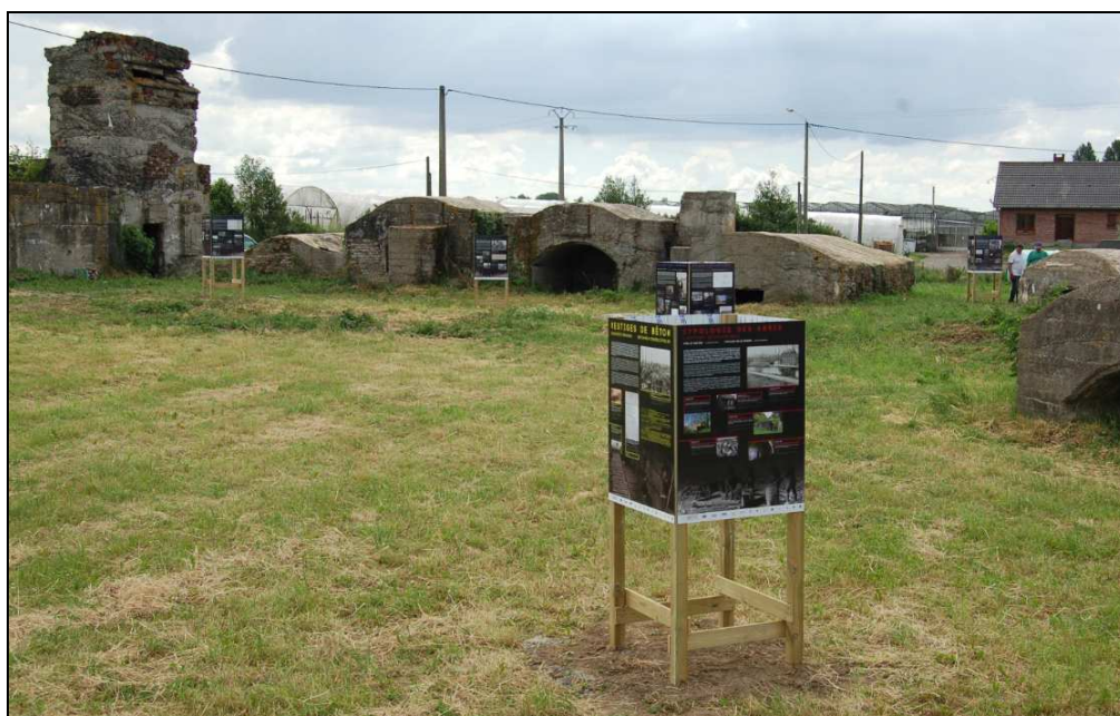
Les cinq îlots constituant l'exposition sont implantés au milieu d'un complexe militaire construit par les Allemands.

Le site dispose d'un complexe de blockhaus construits à l'arrière du front par les Allemands, en 1915-1916. Une tour d'observation et des soutes à munitions laissent supposer que le site abritait une batterie d'artillerie. Les ouvrages sont pour la plupart localisés sur un terrain appartenant à la commune d'Illies, partenaire du projet.