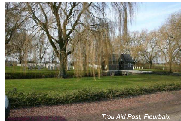
Trou Aid Post, Fleurbaix

Derrière le front britannique face à Fromelles, les Britanniques installèrent un poste de premier secours juste derrière la première ligne de feu, dans un lieu-dit nommé le Trou sur la commune de Fleurbaix. Y furent inhumés les corps de soldats tombés lors des batailles de la côte d'Aubers (9 mai 1915) et de Fromelles (19 et 20 juillet 1916).